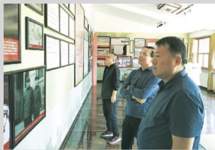
参观大青山抗日游击队司令部纪念馆。