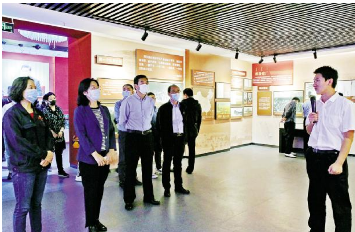
包头市司法局机关干部参观包钢红色展厅。

通过一个月系列活动的开展,有效增进了司法局机关全体干部对民族团结政策知识的了解和对民族团结进步工作的认识,为进一步维护社会稳定,巩固和发展平等、团结、互助、和谐的社会主义民族关系营造了良好的法治环境。