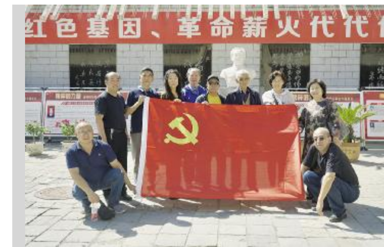
党支部人员、离退休老干部在王若飞纪念馆参观践学。

9月10日,包头市司法局第三、第五党支部20余人及第四党支部(离退休支部)30余名党员,分赴大青山抗日游击队司令部纪念馆和王若飞纪念馆参观践学,开展了党史学习教育暨铸牢中华民族共同体意识主题党日活动。