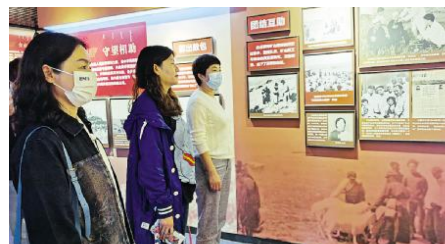
参观包钢红色展厅。