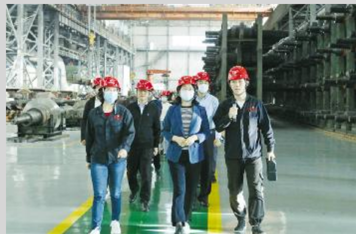
参观包钢轨梁轧钢厂。