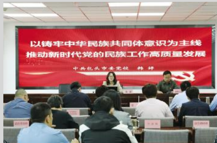
包头市委党校老师开展民族工作专题讲座。