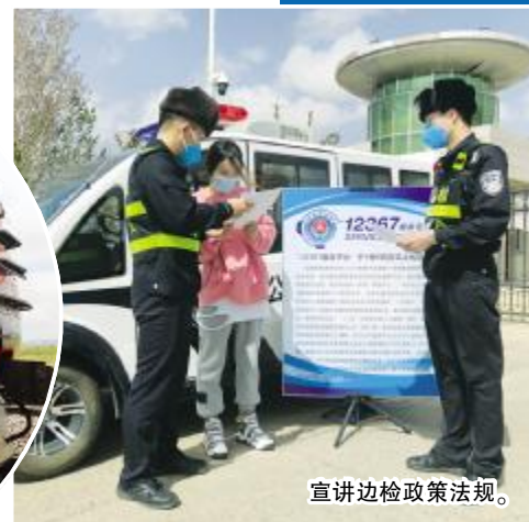
宣讲边检政策法规。