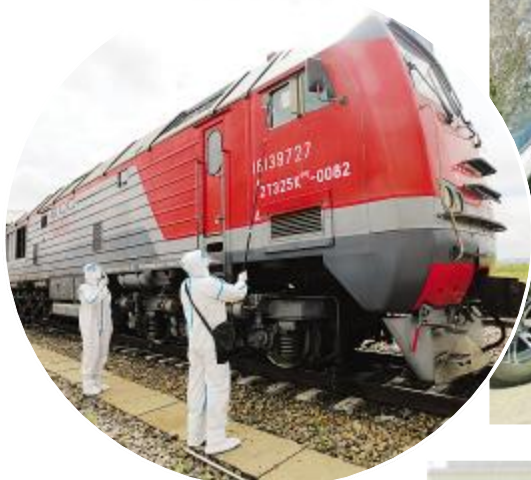
“无接触”采集司机证件信息。