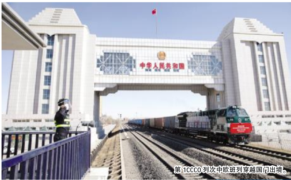
第 10000 列次中欧班列穿越国门出境。

“下一步,我们将持续推动教育整顿成果制度化、常态化,强化‘国门卫士’忠诚担当,筑牢国门口岸钢铁防线,纵深推进‘放管服’改革,打通为民服务‘最后一公里’,护航口岸经济发展和人民安居乐业。”该站站长葛彦昌说。