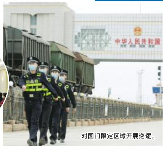
对国门限定区域开展巡逻。