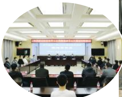
召开教育整顿新闻发布会。