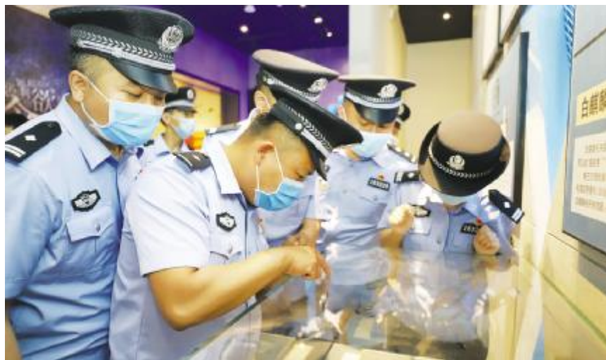
为进一步加强党风廉政建设,切实增强广大党员民警廉洁自律意识,筑牢反腐倡廉底线,近日,海拉尔出入境边防检查站组织党员民警参观呼伦贝尔市反腐倡廉警示教育基地,接受廉政警示教育。