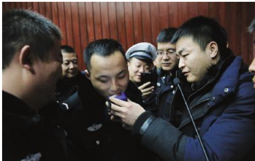
为有效避免公安交通民警在执勤执法过程中处置危险化学品车辆事故现场时发生伤亡事故,切实保障民警的人身安全,按照“贴近实战,保障基层”的原则,鄂尔多斯市公安局交管支队于近日将153套防化服及相关设备配发给基层一线交管大队。图为专业人员在向民警做产品演示。

通过开展此次宣传活动,提高了群众对扫黑除恶专项斗争的认识,使扫黑除恶专项斗争深入人心,营造了浓厚的法治宣传氛围。(李福军)